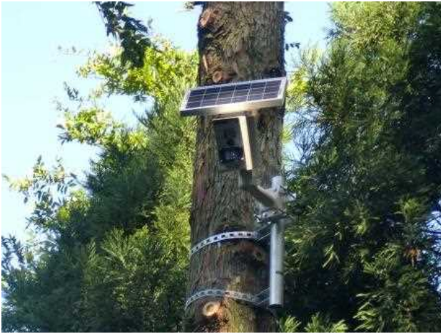
図 7-3 市内に設置している監視カメラ