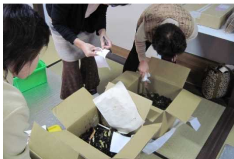
図 7-2-2 出前講座の様子（ダンボールコンポスト）

出前講座などでの普及啓発に取り組んでおり、講習会を受講された方からは「ほかの方法と違い臭いや虫の発生もほとんどなく、堆肥化に成功した。」といった喜びの声をお聞きしています。