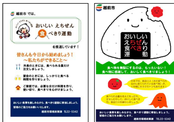
図 7-2-3 「おいしいえちぜん食べきり運動」啓発チラシ