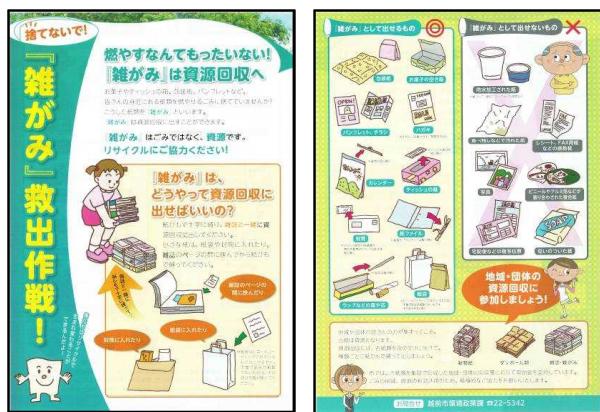
図 7-2-1 「雑がみ救出作戦」啓発チラシ