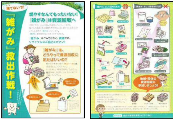
図 7-2-3 「雑がみ救出作戦」啓発チラシ