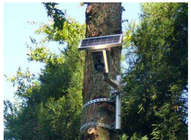
図 7-3 市内に設置している監視カメラ