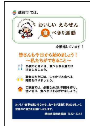
図 7-2-4 「おいしいえちぜん食べきり運動」啓発チラシ