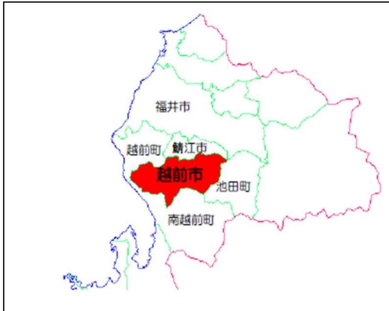
図1 越前市の位置図