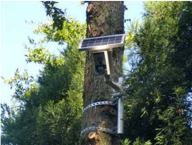
図 7-3-1 市内に設置している監視カメラ