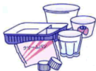
プラスチック製容器包装