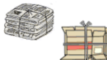
新聞・雑誌、ダンボール