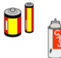
電池・スプレー缶