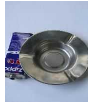
Gạt tàn thuốc được làm bằng kim loại

Ngoài những loại chai, lọ đựng thức uống, chẳng hạn như lọ mỹ phẩm v.v.... ※Sau khi sử dụng hết bên trong, hãy đem bỏ vào giỏ thu hồi.