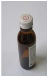
Nắp của chai đựng thức uống

Các loại nắp được làm bằng nhựa hoặc bằng kim loại là "Rác không cháy". Chai → Giỏ đựng đồ màu nâu. Chai vỡ → Rác tái nguyên