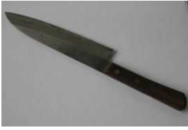
Dao làm bếp, dao (Khi vứt những loại rác có đầu nhọn hay nguy