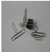
Văn phòng phẩm được làm bằng nhôm và sắt

Các loại nắp được làm bằng nhựa hoặc bằng kim loại là "Rác không cháy". Chai → Giỏ đựng đồ màu nâu. Chai vỡ → Rác tái nguyên