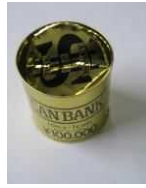
Lon tiết kiệm tiền