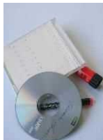
Hộp đựng đĩa CD • CD

Móc treo • Ví nướng sử dụng trong cho nấu ăn • Chất hút ẩm thực phẩm Những loại dây điện • Cốc giấy bạc sử dụng cho cơm hộp Vui lòng cắt trong vòng 1m. • Gói nhôm