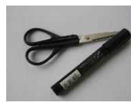
Kéo, bút dạ Bọc mép kéo bằng vải.