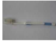
Bàn chải đánh răng