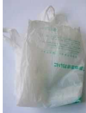
Túi mua hàng