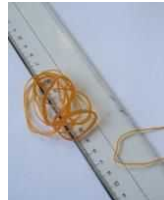
Dây cao su, văn phòng phẩm bằng nhựa

Đồ trang trí bằng thủy tinh • Thùng rác bằng nhựa • Đôi giày • dép • Cái móc lịch