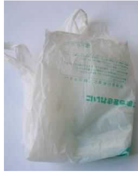
レジ袋 (商品が入っていたプラスチック製袋)