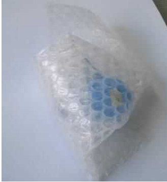
壊れ物を包んでいる プラスチック製の緩衝材