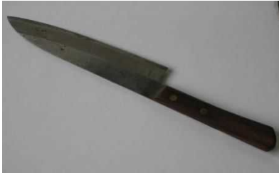
包丁やナイフ (危険がないように刃に布 やテープを巻いてください)