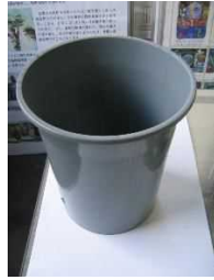
プラスチック製ゴミ箱