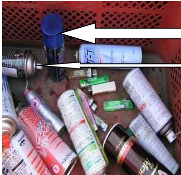
化粧品のキャップ予スプレー缶 のノズルで、プラスチック製の表 示があるもの