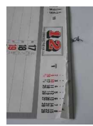
カレンダーの留金