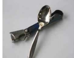
スプーン・栓抜き・缶きり