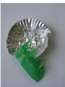
弁当のバラ／ アルミパック