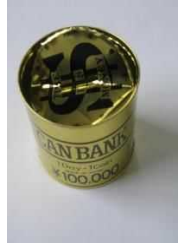
空き缶の貯金箱 (飲食物の空き缶とは違います)