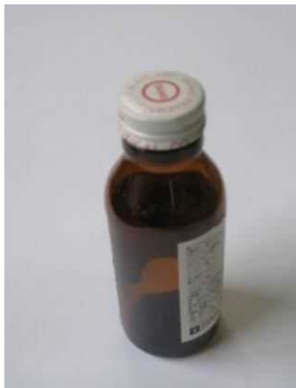
飲食物の入ったびんの蓋