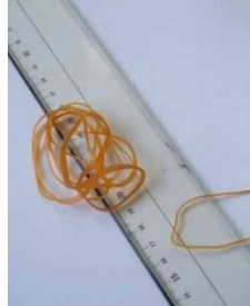
輪ゴム・定規プラスチック製文房具