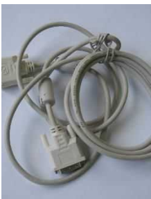
電気コード類 (1m以内に切る)