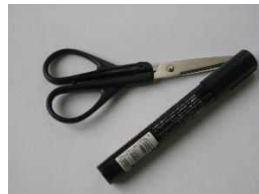
はさみやマジック