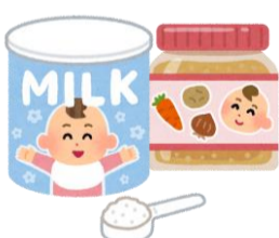
粉ミルク・離乳食