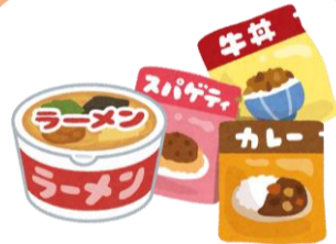
レトルト・インスタント食品