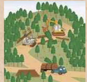
適切に森林整備を推進！

ことから、森林の土地の所有者の把握を進めるため、平成24年4月から森林法に基づく森林の土地の所有者となった旨の届出制度が創設されました。なお、この届出により、森林の土地の所有権の帰属が確定されるものではありません。