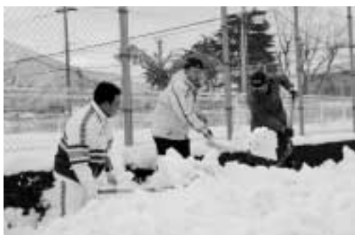
▲硬い雪の山に登り懸命に雪かきする市民の皆さん

除雪に参加した市民の皆さんは、一斉に歩道に散らばり、山積みになった硬い雪を、スコップやつるはしを使って懸命にかき出していました。