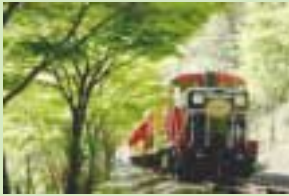
嵯峨野トロロク電車(イメージ)

とき 3月21日(日) 午前8時40分 JR武生駅集合 午後7時20分 JR武生駅解散 行き先 京都(JR特急列車使用) 現地では自由散策 定員 100人