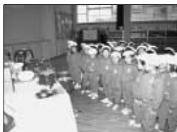
▲鼓隊セットの贈呈を受ける国高幼稚園の園児たち

贈呈を受けた園児の皆さんからは、大事に使います。ありがとうございました。」とお礼の言葉がありました。