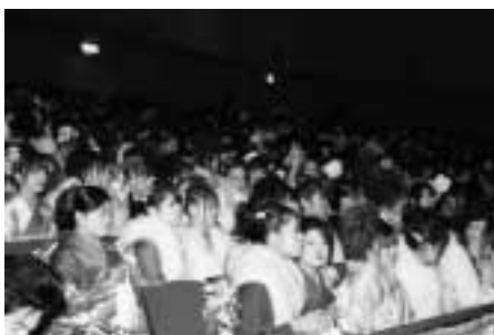
▲華やかな衣裳に身を包んだ新成人