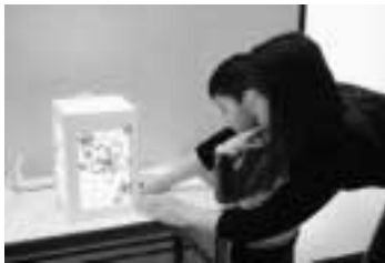
▲「あんどん」に明かりをつける親子