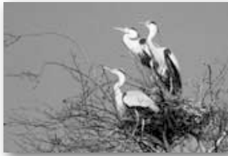
▲樹木の枝に巣を作り子育てする青サギ

近年、サギの営巣による異臭や鳴き声に関する相談・問い合わせが多くなっています。数年前には、春先から夏にかけて社寺境内で、数百羽のサギ類が営巣し、大きな問題となりました。