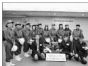
▲整備された消防ポンプと北府四丁目自警隊婦人部の皆さん