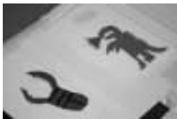
▲怪獣や昆虫の切り絵

切り絵を台紙に貼り、電球を囲って完成した「あんどん」は、明かりをつけると、種類が豊富な和紙ならではの風合いが一段と映え、幻想的で温かな作品になりました。