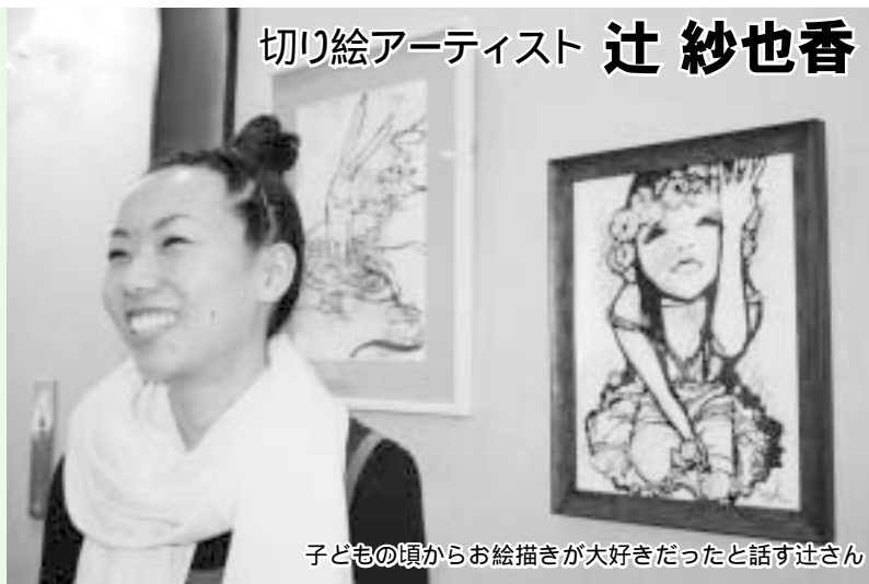
子どもの頃から絵描きが大好きだったと話す辻さん