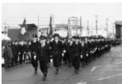
▲総勢580人による分列行進

や市消防団員など合わせて580人が参加し、ポンプ車やはしご車からの一斉放水などで、今年一年の防火の決意を新たにしました。