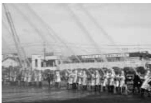
▲26台のはしご車、ポンプ車による一斉放水