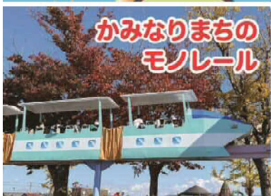
かみなりまちの モノレール