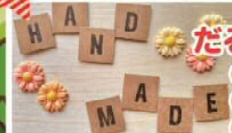
だるまちゃんマルシェ ●クラフト作品販売 ●ワークショップ ●リラクゼーション