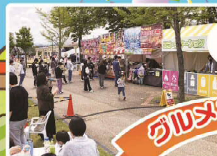
キッチンカー 大集合!