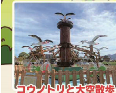
コウノトリと大空散歩