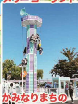
かみなりまちの ほうでんとう