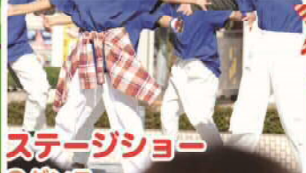
ステージショー ●ダンス ●演奏など