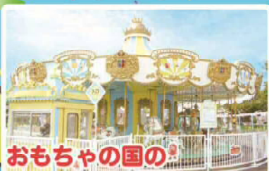
おもちゃの国の メリーゴーランド