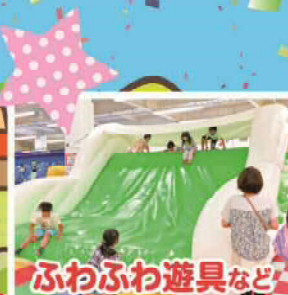
ふわふわ遊具など