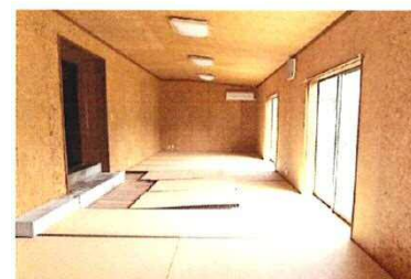
和室 → 木版画ワークショップ