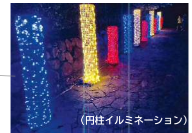
(イルミネーション・ライトアップイメージ)