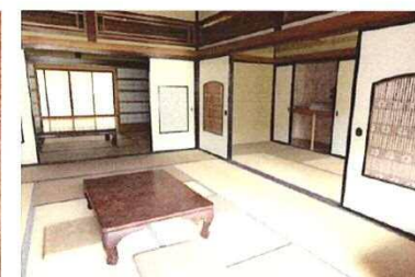
座敷 → 宿泊施設・事務所