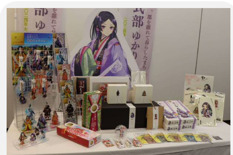
開発商品イメージ ※令5年6月8日「しきがきぶん」ロゴマーク・「平安ゆかりのキャラクター」を活用した商品のお披露目会にて発表された商品群

※本補助金を活用し、開発された商品は、 商品お披露目会(2月予定) にて発表を行う。