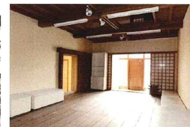
1階 → ギャラリー