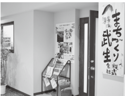
4月1日に設立された「まちづくり武生(株)」 (JR武生駅前センチュリープラザ1階)

答 これまでの約8年間で3人がタウンマネージャーを務めた。具体的な成果として、空き家、空き店舗、空き地の活用を目的とした所有者と利用者のマッチング、市民が開催するにぎわいイベント等の支援や、新たなイベントの企画実施、町なか商店街の販売促進の取組み、新規開業支援等である。まちづくり武生(株)に移行後、これまでの事業に加えて、サブリース事業等の新たな自主事業を実施するので、新体制のもとタウンマネージャーに託す役割は、これまで以上のものになると考えている。