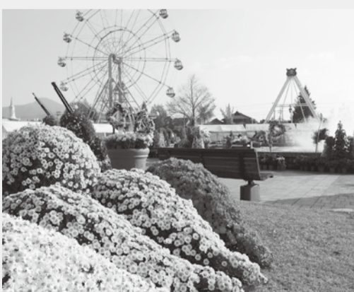
今年で64回目を迎える たけふ菊人形

理事者からは、菊人形は、越前市の観光資源であるが、市民の中に菊人形の存在が少いと感じられるように感じられる。市民の方に愛される菊人形をもう一度作り上げるためにも、菊人の造形等、家族が楽しめる雰囲気づくりも必要であると述べている。また、観光全体においては、越前和紙、越前打刃物、越前指物の3つの地元伝統産業を中心に据え、近隣市町とも連携も図っていきたいとの答弁がなされました。