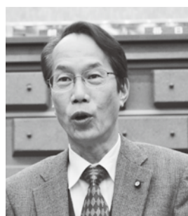
日本共産党議員団 前田 修治