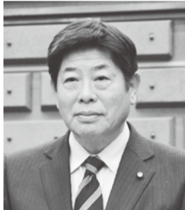
未来 小形 善信