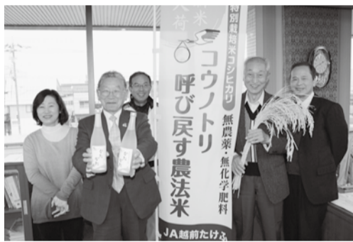
無農薬・無化学肥料の コウノトリブランド商品

答 まず、ブランド化1号として「コウノトリを呼び戻す農法米」、2号として、この農法で栽培した酒米を使った純米吟醸「かたかた」、3号として羽二重餅「このとり舞」というお菓子があつた。米については年々栽培面積も増加しており、都市部を中心に販売されていると聞いている。