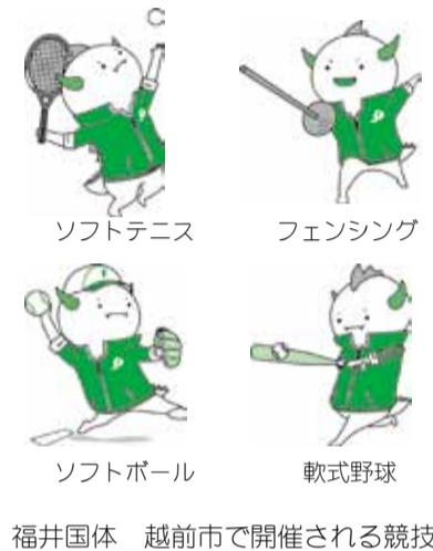
福井国体 越前市で開催される競技

答 簡素で効率的な行政運営を目指し、半世紀に一度のまちづくりの着実な進捗を図る観点から社会基盤整備を一体的に進める必要がある。災害発生時等の社会基盤復興等の応援態勢を強化する意味もあり統合した。また、国体推進課は、平成30年に開催される国体について全庁的・全市的に取り組む必要がある。任期付職員を採用し国体の実行委員会と連携しながら推進に向けた事業をする。