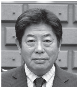
未来 小形 善信