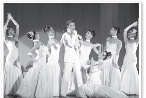
今年は文化センター大ホールで開催されるOSK公演

答 OSK公演の会場が文化センター中 ホールから大ホールに変更になる。また、 中学生以下の入場料・OSK観劇料の無料 化や、65回記念事業としてOSKの無料 観劇券を全戸配付することを考えている。 さらに会場整備については、おみやげ横 丁を正面付近へ移設、五重塔を菊人形館 近くに移設し、正面入口から菊人形会場 全体が見渡せるような景観の修正を考え ている。