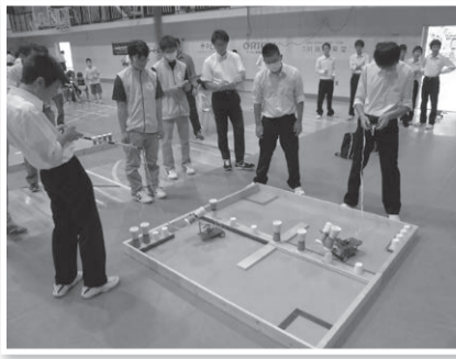
モノづくり教育を通して、創造、チャレンジする気風や意欲を高めるロボットコンテスト(会場:福井高専)

答 コンテスト参加に当たり小さなロボット作成キットを購入いただくが、その費用を補助する予定である。小学生の段階からものづくりのおもしろさを体験し、最先端の技術に触れる機会を増やしていきたい。