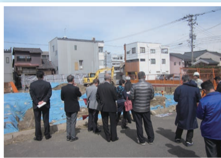
平安時代の遺構(柱の穴)や須恵器などが発見された駐車場建設予定地(幸町)

総務委員会は、3月16日に立体駐車場建設予定地における埋蔵文化財の発掘状況の調査を実施しました。 当日は、現地において、関係理事者及び埋蔵文化財発掘調査業務を請け負う調査員から説明を受けました。 3月定例会で審議された平成27年度一般会計補正予算(第7号)中の、埋蔵文化財調査工事業費の予算の減額補正理由については、遺跡の調査は当初二層で予定されていましたが、平安時代の遺跡が一層に集約される複数の年代であったことから一層のみの調査となったためであることを確認しました。 また、今後、本庁舎の基本設計、実施設計を行っていく上での調査については、時間的余裕をもって取り組むことが望ましいとの意見がありました。