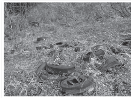
山中に不法に投棄されたタイヤ

答 監視カメラは3台購入し、2台は長年 不法投棄が問題となっている山間部に設置 する。残りの1台は1か所に固定せず、 不法投棄の発生状況に応じて設置場所を変 えていく。