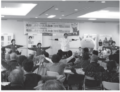
介護予防に効果のある「越前市つどい体操」

答 地域住民の支え合いによる高齢者の見 守り、「いきいきふれあいのつどい」の拡 充や高齢者の日常生活の簡単な支援等の拠 点とすることが求められる。