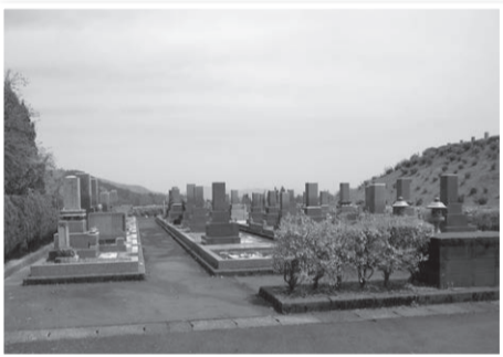
今年から道路の舗装修繕工事にとりかかる鴨谷霊苑

問 霊園の当初使用料・年間使用料を値上げすることだが、その理由は何か。 答 使用料はずっと据え置いてきたが、鴨谷霊苑は造成から40年以上、佐山鹿ノ楽墓園も28年以上経過した。舗装等の施設が老朽化しており、その修繕に充てるため、受益者負担の原則に立ち使用料を改定する。