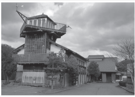
市の環境教育の拠点であり、災害時は防災拠点となるエコビレッジ交流センター

答 設置から約15年が経過し、発電能力が 低下してきている。坂口公民館と一体的に 利用されている施設であり、災害時の防災 拠点としても活用する公共施設として適当 であると判断した。