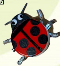
ペットボトルキャップ のてんとうむし

ゴールデンウィークのイベントに参加すると、5/5に行う千本くじの抽選券になる塗り絵がもらえるよ。たくさん集めてね。ゴールデンウィークのイベント詳細は別チラシをご覧ください