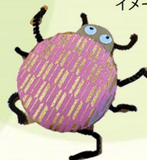
越前和紙の てんとうむし