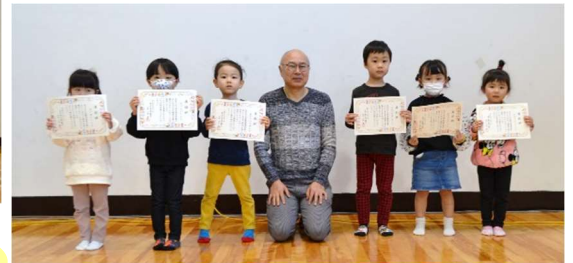
▲虫歯のない子表彰