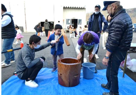
▲やってみたら楽しかったよ！ 掛け声に合わせてお餅つき！