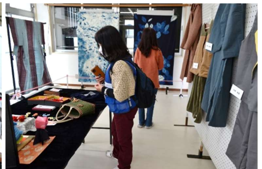
▲どうやって作ったのかなあ 素敵な織り、染め、手芸作品

2月18日(日)、冬まつりが開催され、約300人の来場者は地域の方々のきらりと光る作品やステージ発表を楽しみました。お天気にも恵まれ、屋外のお楽しみコーナーでは、ふるまい餅やふるまい鍋、お獅子焼き、焼き芋、綿菓子、おにぎり、赤米ポン菓子などを頂きながら話に花を咲かせていました。また、小学生がチアダンスや太極拳、踊りを披露したり、学校で企画した「赤米せんべい」を販売したりする姿もありました。「赤米せんべい」は南中山公民館で販売しています。冬まつりの準備から当日まで、様々な役割を担っていただいた方々に心から感謝申し上げます。なお、写真など一部の作品は、3月20日頃まで公民館2階で展示していますので、どうぞご覧ください。