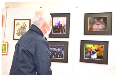
▲写真や絵画を鑑賞