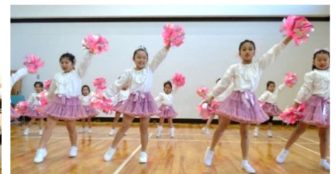
▲チアダンス“ソアーズ”