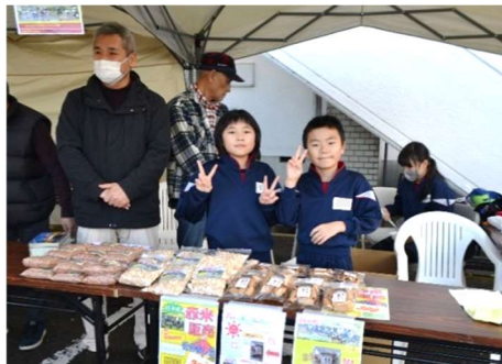
▲小学生が、赤米商品を販売 “赤米せんべい”もたくさん売れたよ