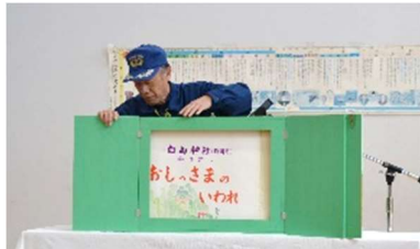
▲紙芝居で南中山の昔話を