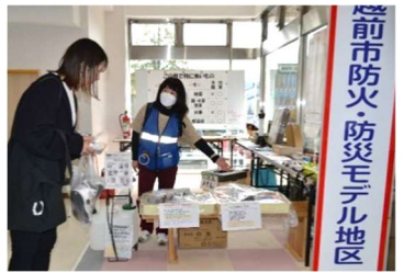
▲防災展示コーナー