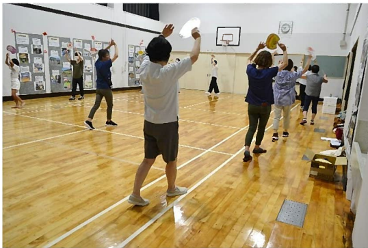
▲ 7月28日 踊りの練習会の様子