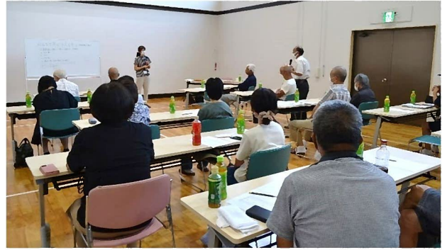
▲ 実際に関わっておられる方の疑問にも 答えていただきました