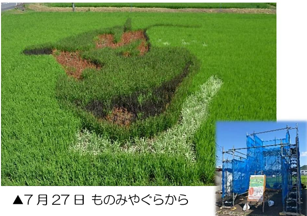
▲7月27日 ものみやぐらから

公民館の駐車場北側に田んぼアートのものみやぐらを設置しました。赤米の田んぼに浮かび上がる「お獅子さま」の田んぼアートを見に来てくださいね。