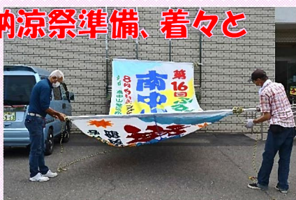
懸垂幕とのぼり旗の設置