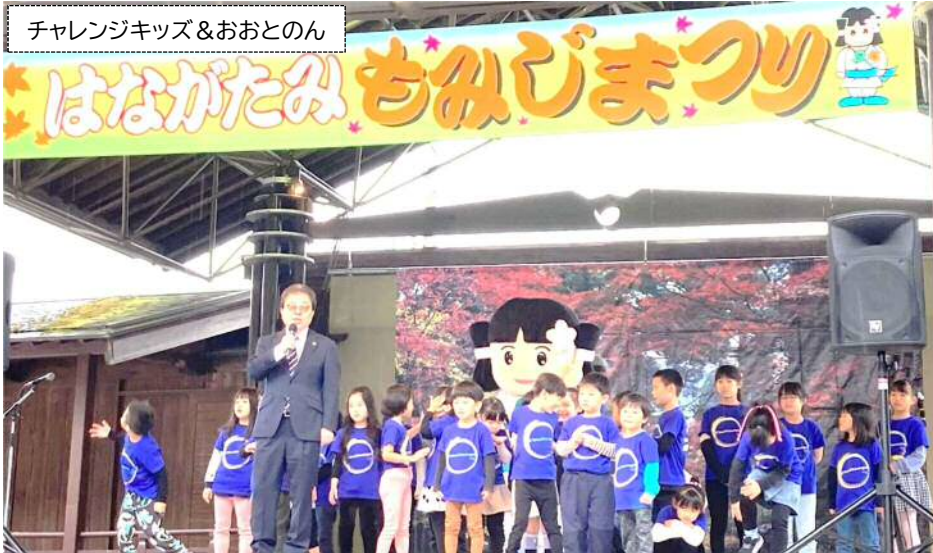
チャレンジキッズ&おとのん