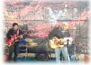
←もみじの 下で唄会