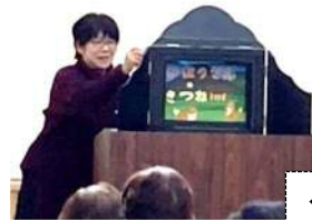
← ひとみちゃんの《紙しばい》