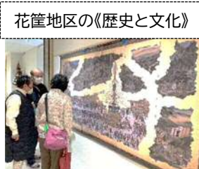
花筐地区の《歴史と文化》