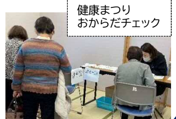
健康まつり おからだチェック