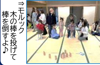
⇒モルック 木の棒を投げて 棒を倒すよ!

11月12日(日)、花筐会館にて“3歳児むし歯のない子表彰式”を行いました。対象者 23 名のうち、21名の参加があり、表彰式の後にはモルックを楽しんでもらいました。これからむし歯にならないように気をつけようね。