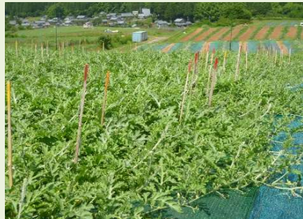
収穫の目印となる着果棒がズラリ

西瓜が大きくなってきたら越前警察署（白山駐在所）に依頼し、盗難防止の西瓜パトロールをしてもらいます。