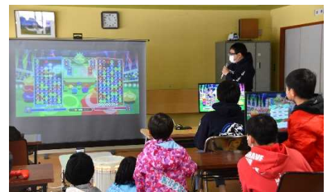
eスポーツのコーナーでは子供だけでなく大人も夢中に!?