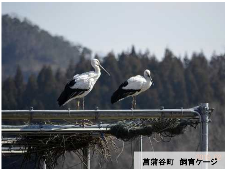
菖蒲谷町 飼育ケージ