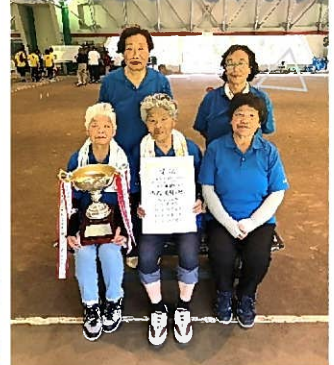
ゲートボール女子