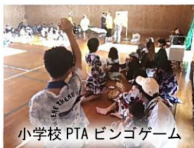
小学校PTA ビンゴゲーム