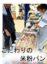
こだわりの 米粉パン