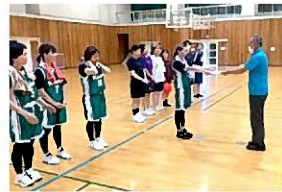
バスケットボール女子