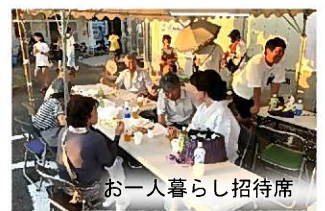
お一人暮らし招待席