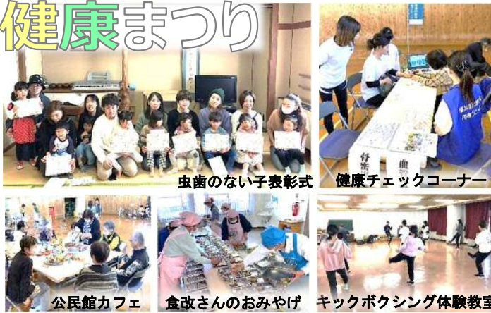
虫歯のない子表彰式