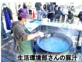
生活環境部さんの豚汁