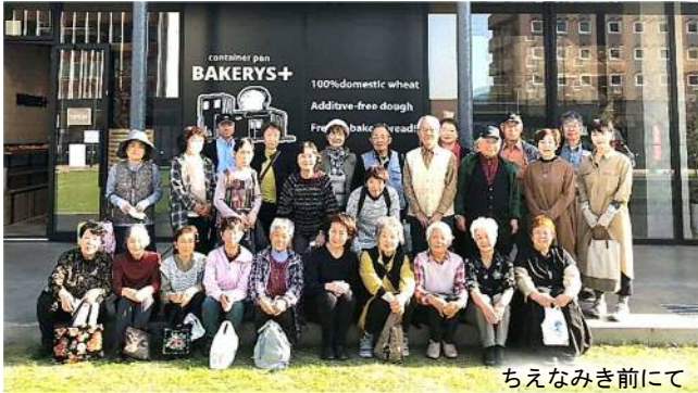
ちえなみき前にて