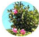
公民館裏口の サザンカ