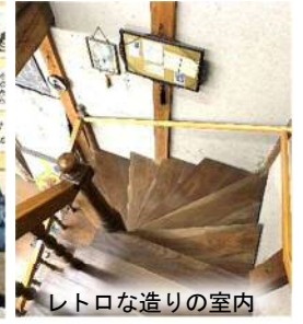
レトロな造りの室内