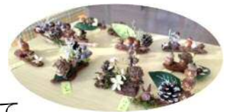
とってもかわいい作品ができました♪