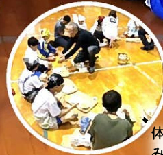
体育館で輪になってみんなで非常食体験!