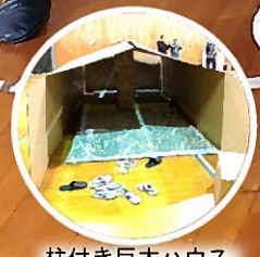
柱付き巨大ハウス