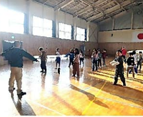
やっぱり朝はラジオ体操!