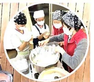
ハイゼックス炊飯袋を使ったご飯作りに挑戦!