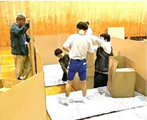
お楽しみは段ボールハウス作り。体育館で寝ました。