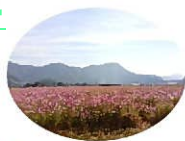
コスモス畑と三里山