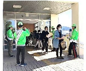
▲文化祭会場入り口にて

コロナ禍で3年程活動自体が自粛されていましたが、昨年新調した蛍光グリーンジャンパー・帽子で正装し啓発チラシにティッシュ、お菓子、カレンダーなど盛りだくさんの袋を配布しました。