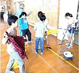
最後はもちろんお掃除です。