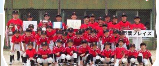
万葉プレイズ 4月28日29日に高円宮賜杯第44回全日本学童軟式野球大会マクドナルド・トーナメント越前支部予選会が行われ、万葉プレイズが優勝しました