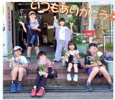
5/11 母の日のフラワーアレンジメント