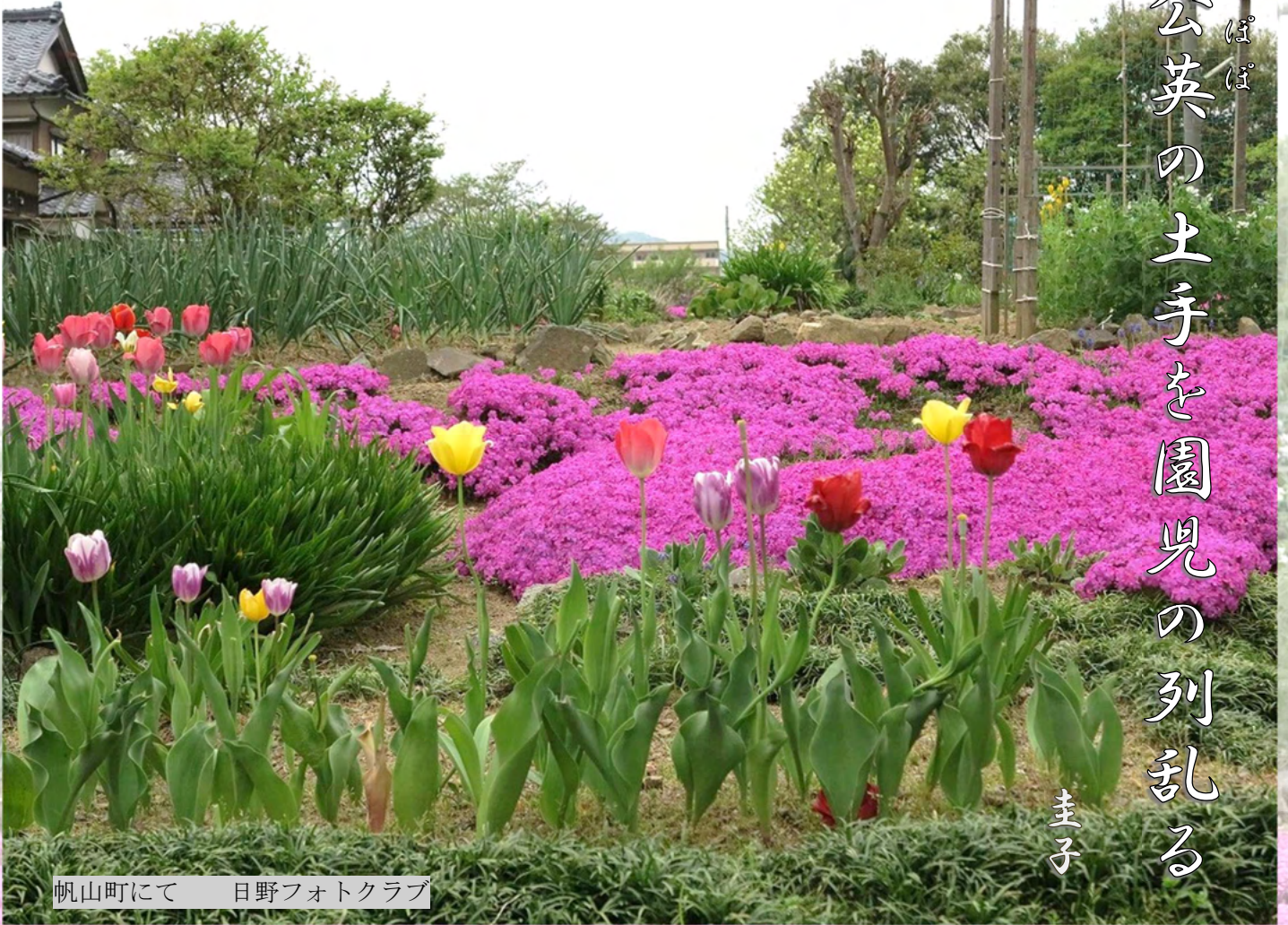
帆山町にて 日野フォトクラブ