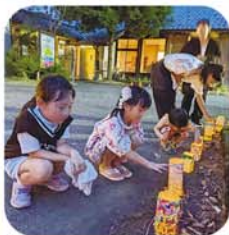
牛乳パックでキャンドルライトを作り納涼祭で展示しました。