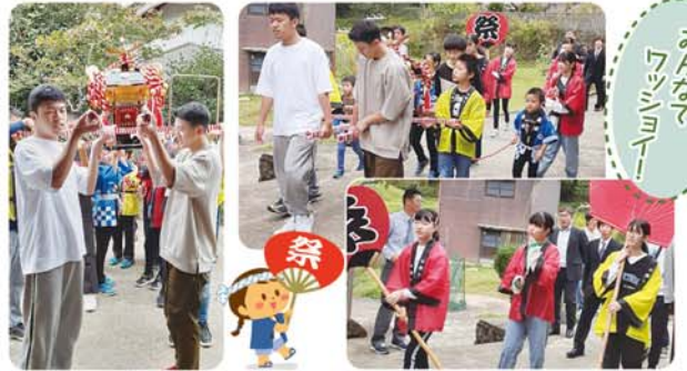
みんながワッショイ!

勾当原町では10月8日(日)に秋祭りがありました。今年度は4年ぶりに子供神輿も行われ、はっぴを着た子らが29軒をまわりました。家の前では神の御霊を運ぶとされる神輿を担ぎ、ワッショイワッショイの掛け声とともに農作物収穫への感謝や町民の幸せを祈願してくれました。4年前に比べると子ども達の顔ぶれも代わっていて、子ども達の成長もうかがえました。少子化が進む中、無事に子供神輿が開催されたことに感謝したいと思います。