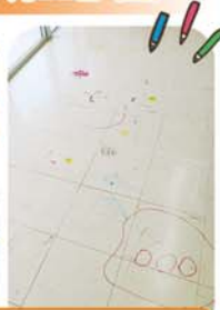
廊下に壁にそして床に、思いっきり描きました!