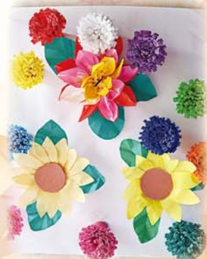
手づくりの素敵な作品が飾られています