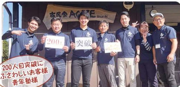
200人目突破に ふさわしいお客様 青年塾様

10月初めに今年度のお泊まり客が200人を突破しました。7～8月は平日でも満室になることもあり、AOIIEを拠点に海に山に恐竜博物館にと行かれる方が多かったようです。突破記念のお客様は坂口にふさわしい「青年塾」の御一行様です。