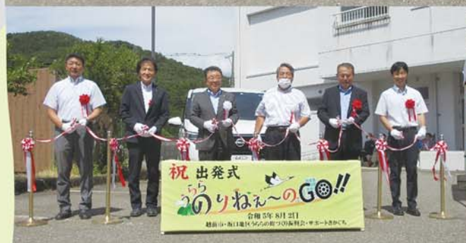
祝 出発式 うららのりねえ〜のGO!! 令和5年8月21日 越前市・坂口地区民生活の質の向上の取組の推進会・サポーターから