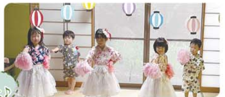
上手におどれるよ!