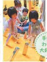
手作り わなげ 大好評!

若いママたちが大奮闘! 手作り感いっぱいのお祭りに、集会所は笑い声がひびきあふれました。