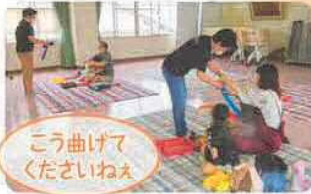
こう曲げて くださいねえ