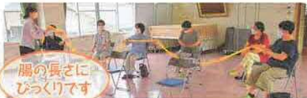
腸の長さ びっくりです

“腸”や“菌”の働きや大切さを知る「おなか元気教室」を開催しました。病気にかからないようにするためには予防が大切であり、そのためにはおなかを元気にすることが必要です。健腸長寿のために正しい食生活・生活習慣で過ごしましょう。