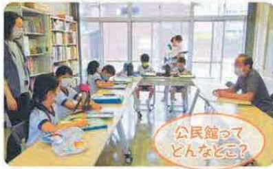
公民館って どんなところ?

町探検に公民館に来てくれた子ども達。中野公民館長さんから公民館の話聞いたあと、質問タイムに。「どうして坂口というのですか?」など鋭い質問に驚きながら答えていきました。また公民館に遊びに来てくださいね。