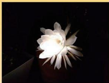
月下美人が、10年ぶりに 1輪咲きました