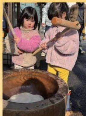
可愛いもちつきぺったんこ！