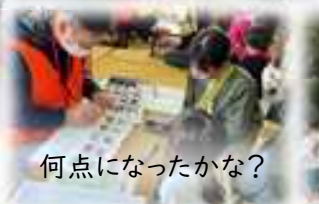
何点になったかな?