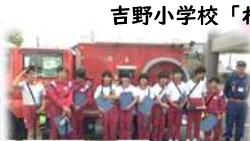
消防団の消防車展示説明