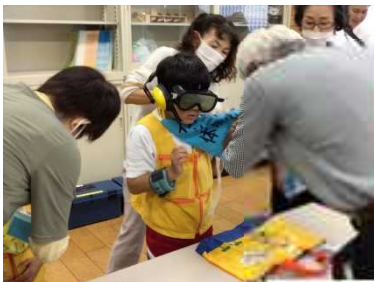
民生児童委員の高齢者体験