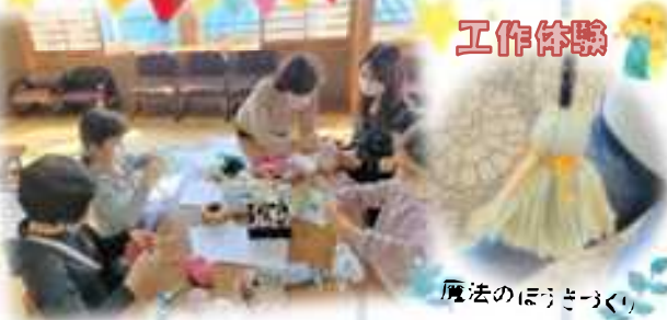
魔法のぼうきづくり