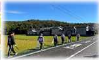
青空の下、心も晴れやか