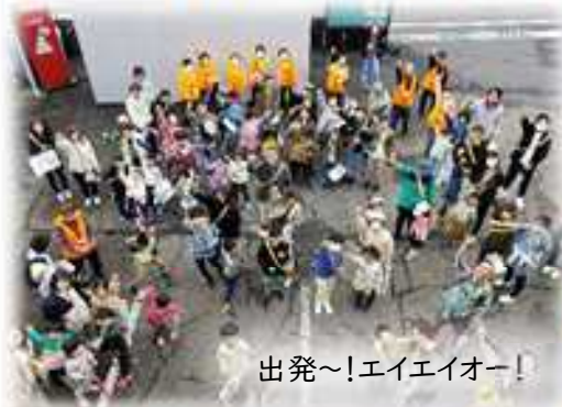
出発～!エイエイオー!