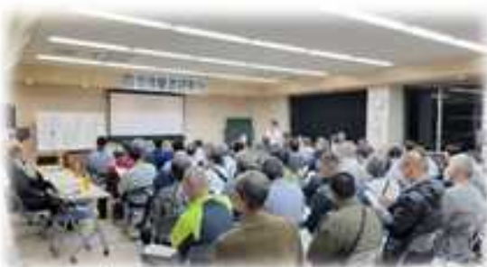
区長始め、町内役員や防災団体の皆さん、63名が参加されました