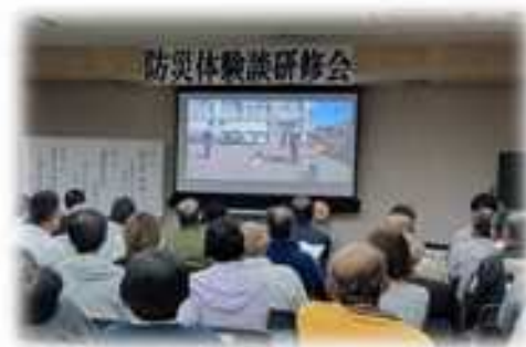
家久町の防災訓練の様子も紹介されました