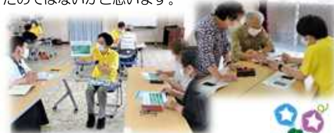
2名に1人の指導員 手厚い指導をいただきました

プログラムが終了した後は 20 分ほどのフリータイム。自分が普段使っていて分からないと思ったところを聞くなどしていました。一つ一つ丁寧に教えてもらい、スマホでできることが、また一つ増えたのではないかと思います。