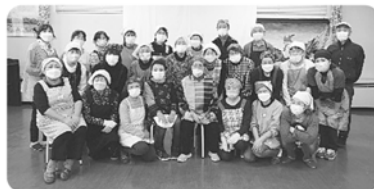
食事サービス 12月10日

コロナ感染拡大の影響で中止になった事業もありましたが、社会福祉部会では高齢者への食事サービスをはじめ、高齢者訪問、在宅介護者交流サロンと高齢者事業は実施することができました。また、今年度はほとんどの事業に全部員が参加協力していただきました。感謝しかありません。