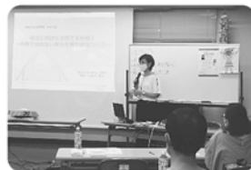
子育て講演会 9月9日

今年度の主な活動は、育児サロン・登下校見守り活動サポート・親子防災学習・子育て講演会・二十歳のつどいなど、