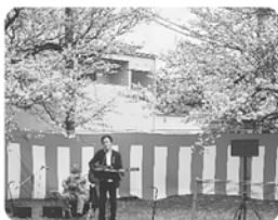
みなみ de カフェ ～南の小さなお花見会～ 4月3日

広報紙『南の風ニコ・サン』で多くの方に地域の生き生きとした情報を届けるように努力しました。また、公民館で地区民の皆さんが交流できるように工夫しました。