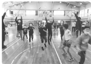
みなりピック 11月6日

健康推進部会は、地区住民が健康である事を願い、健康である事を意識してもらう事を願い活動をしています。行事としては、健康まつり・みなりピック・健康講座・1町内1事業等、実施しています。今年度は、南地区高齢者対象の体力測定を行いました。初めての行事で反省をすることが沢山あり、次回はもっとより良い体力測定にしたいと思っています。高齢者の