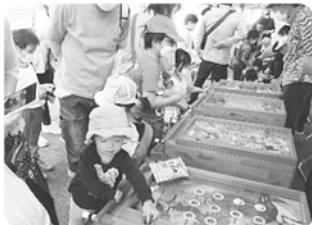
ニコ・サンまつり ゲームコーナー 10月16日

今年度の地域魅力部は、歴史散策会「妙法寺散策」・地域伝統産業体験「北陸トンネルとそば打ち体験」・紫式部周辺清掃・ニコ・サンまつり「ゲームコーナー」の活動を企画・運営しました。雨で中止もありましたが、部員皆さんの協力をいただき、楽しく活動出来ました。次年度は一層地域の魅力発信に努められたらと思います。