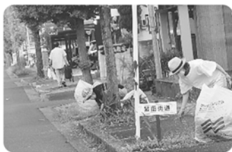
紫蘭街道整備 10月2日

1年間、長いような気がしていましたが過ぎてみると、あっという間だったように思えます。