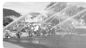
地区防災避難訓練 9月25日

今年度は南地区が「越前市防火・防災モデル地区」に指定されたこともあって、第二次防災避難訓練も市や消防組合との共催事業となり、会場を武生第二中学校1箇所に。また、コロナ対策のため各町内の参加者を10人に絞っての実施でしたが、