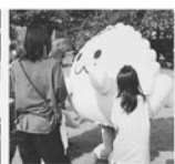
しきぶわいわいパーク

10.7⑤ ▶▶ 10.21⑤ 10.21⑤ 10.21⑤ 22⑤ 17:30~21:00 18:00~20:30 10:00~16:00