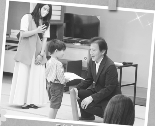
これからも、歯を大切にね…