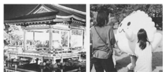
コンサート・レーザーショー 千年の調べ