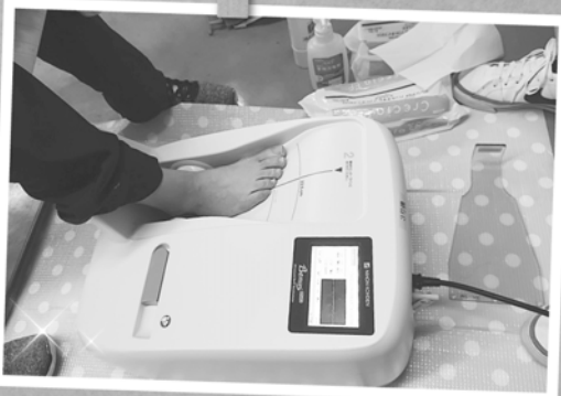
私の骨、何歳の判定かな…ドキドキ