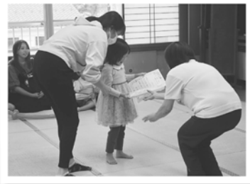
虫歯のない子表彰