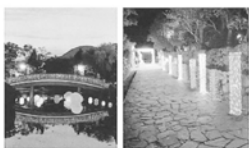
イルミネーションライトアップ 千年の輝き