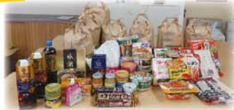
集まった食品たち!

6月4日の「みなみdeカフェ」は、SDGsの取り組みとしてフードドライブを実施しました。「わたしにもできるSDGsを!」と呼び掛け、食品の無駄をなくすことの手段の一つを実践しました。集まった食品は、越前市社会福祉協議会に提供し、有効に活用してもらう予定です。当日はスタッフとして、放課後子ども教室と「いっしょの会」メンバーの参加がありました。食品を提供下さったみなさん、ありがとうございました。