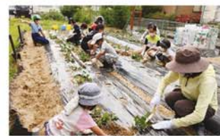
さつまいもの苗植え

6月4日チャレンジ教室の子ども達は、ニコサン農園でさつまいもの苗植えと玉ねぎの収穫を体験しました。今回は「ニコサン農園応援団」として公民館学級の大人の方の参加もありました。農業体験の後はワナゲゲームも楽しみ、久しぶりのチャレンジ教室にみんな笑顔満開でした。