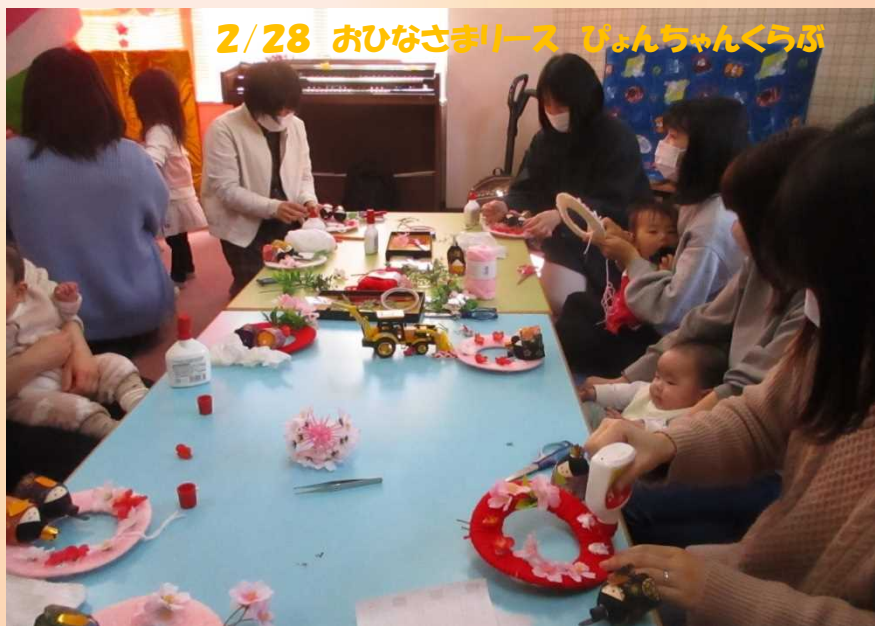
2/28 おひなさまリース びんちゃんくらぶ

発行日 令和5年3月15日 発行 東地区自治振興会 武生東公民館 915-0076 越前市国府2丁目9-12 (振興会) TEL.FAX 0778-23-6546 E-MAIL h-shinkou@wt.ttn.ne.jp (公民館) TEL.FAX 0778-23-4763 E-MAIL takefuhigashi_ko @city.echizen.lg.jp 世帯数 2,214 世帯 総人口 4,828 人 男性 2,331 人 女性 2,497 人 (2023.3.1 現在)