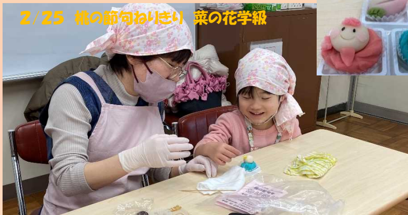
2/25 桃の節句おひなぎり 菜の花学級