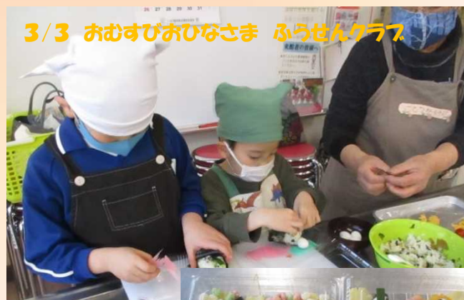
3/3 おむすびおひなさま ふうせんクラブ