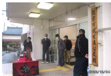
東地区自治振興会 西山

受講された方は真剣に聞き入っていました。各自がそれぞれ実際に操作して本番に備えていました。安全第一で事故を起こさず操作したいものです。