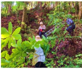
ほうの葉を取りに行きました

十字に置いたほうの葉の上に きな粉、ご飯、もう一度きな 粉のをせました。熱いご飯で 葉が茶色に変色し香りがご飯 にうつりました。いい匂いが しました。懐かしい郷土食、 伝えていきたいです。