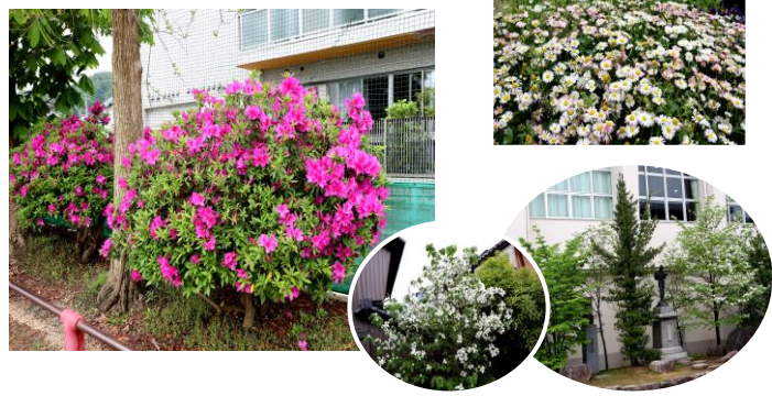
東小学校の周りは新緑の匂いがします 花たちもとってもきれいです