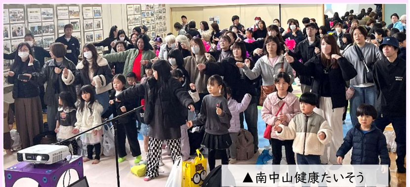
▲南中山健康たいそう