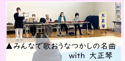
▲みんなで歌おうなつかしの名曲 with 大正琴