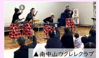
▲南中山ウクレレクラブ