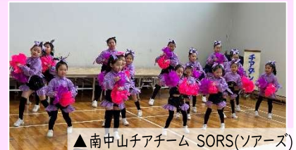
▲南中山チアチーム SORS(ソアーズ)

熱気そのままに、この一年ですっかりお馴染みとなった「南中山健康た いそう」で会場みなさんと体をほぐし、公民館自主講座生のステージ 発表を楽しみました。ご協力いただいた皆様ありがとうございました。