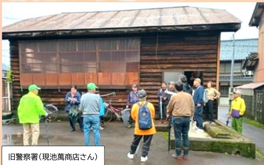
旧警察署(現池萬商店さん)

花筐小学校⇒観音堂⇒旧魚市場⇒旧警察署(現 池萬商店)⇒ 西のお題目岩・西山の地蔵⇒膳亀岩⇒荒檜神社拝殿⇒旧南越 線栗田部駅(現 うすずみ会館)⇒花筐小学校