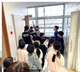
作成チームの 女子5人