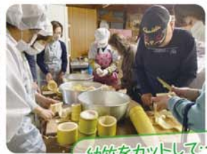
幼竹をカットして...