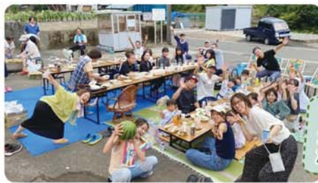
帰省家族も交え、大いに盛り上がった夏祭り (8/9)

3月には美しいふるさと景観づくりとして、「花桃・桜のオーナー記念植樹」を実施し、次号にご報告予定です。