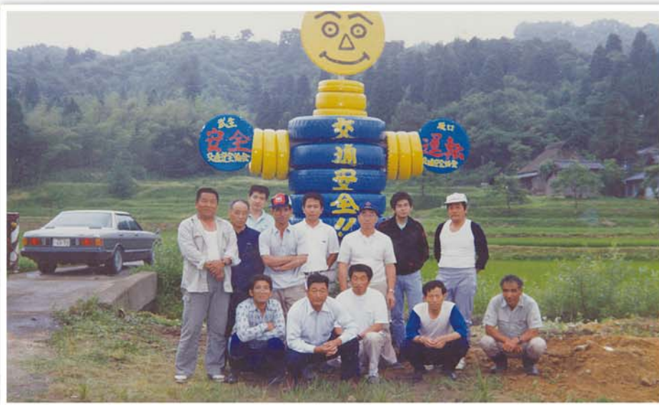
▲タイヤを組み合わせ塗装し、交通安全をアピール