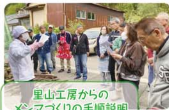
里山工房からのメンマづくりの手順説明