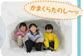
かまくらたのし〜っ