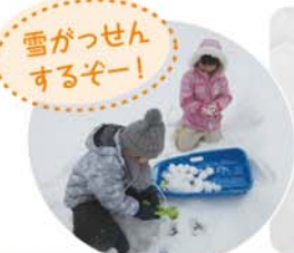
雪がっせんするぞー!

たくさんの雪が積もった駐車場の雪を利用してかまくらを作ったり、ソリや雪合戦をして遊びました。初めて入った大きなかまくらに子ども達も大満足!中に入って「はい、ポーズ」頑張って作ったお家の人達も嬉しそうでした。