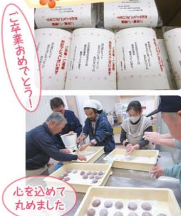
心を込めて丸めました