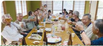
親戚を呼ぶことも少なくなった秋祭り。ならば、自由参加の持ち寄り宴会! (10/12)

高齢化 50%超、16 世帯にまで減少し、限界集落化した中山町。「なんとかせにやならん!」と、市の集落活性化支援事業の支援を受けて