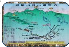
岩籠山登山案内板

*JRで行くのは大変なので、車で登山口までいくことをお勧めします。登山道が3つあるので、体力に合ったコースが選べますよ。