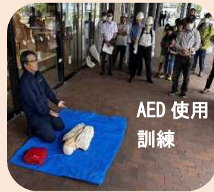
AED 使用 訓練