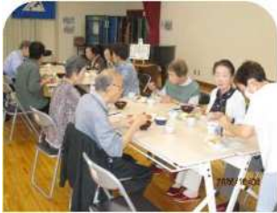
10月 いこいのつどい