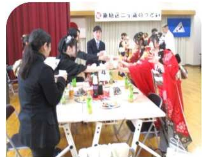
1月 二十歳のつどい