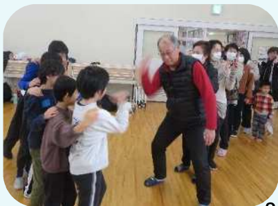
2月 仲間とレクリエーション

東地区自治振興会は、地区の住民等が身近な課題を自主的に解決し、自立的に地区の個性を生かした まちづくりを行うことを目的に設立された組織です。