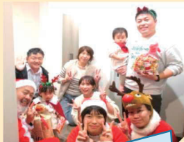
クリスマス。毎年応募がたくさんあります！