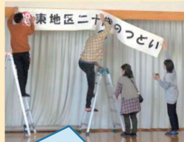
「二十歳のつどい」の設営中。スタッフで協力して準備しています。

青少年育成部では、青少年の健やかな心を育み、心の触れ合いを紡ぐことを基本として、活動を行っています。たとえば「サンタが家にやってくる」「二十歳のつどい」などの主催事業の他、「合宿通学(対象小4)」「地区文化祭」のサポートなどの事業を行っています。これからも参加した青少年によかったと喜んでもらえるよう、地域の未来を若い世代に託せるよう、活動していきます。