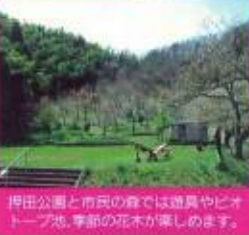
押田公園と市民の森では遊覧やピオトープ池、季節の花木が楽しめます。