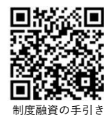
制度融資の手引き

【お問合せ先】越前市役所 産業政策課(市役所本庁2F) TEL:0778-22-3047/FAX:22-5167 MAIL: syokou@city.echizen.lg.jp