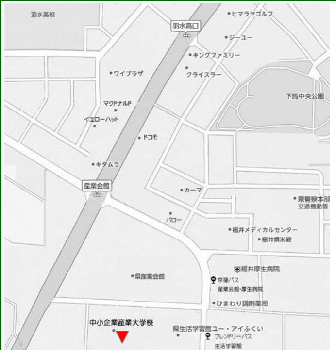
中小企業産業大学校 (福井市下六条町 16-15)