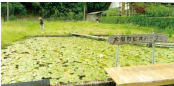
グリーンワークによる美化活動をしています

4年には嶺南方面へ行き若州一滴文庫、水上勉竹人形の館では文筆書の多さ、郷土の子どもたちへの思い、竹人形館の説明を聞き、道の駅うみんぴおお飯でのショッピングを楽しみ、桂由美のウェディング館では数多くの作品に