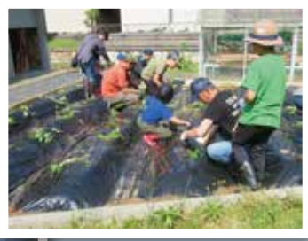
ふれあい農園の様子