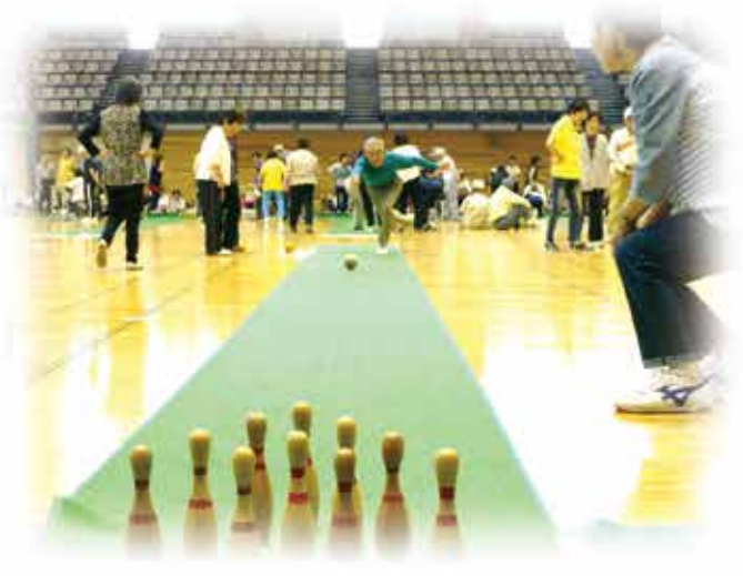
ストライクマッチボウリング大会