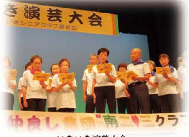
いきいき演芸大会