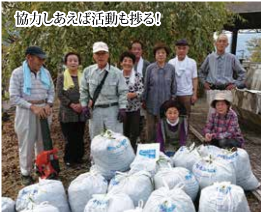
協力しあえば活動も捗る!

をしているところでございます。当初、準備不足や経験不足もあつて戸惑いながらの出発でしたが、設立の目的である「負担軽減」と「会員の健康の維持」であるとの認識が共有されてきたと感じています。まだまだ難題を抱えており前途多難ですが、高齢者が自然と足の向く「花筐クラブ」ができればとおもっています。