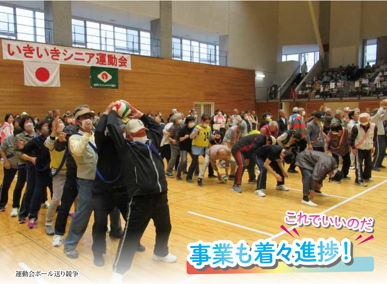
運動会ボール送り競争