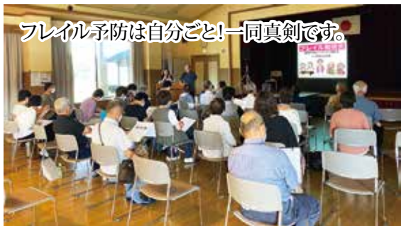
フレイル予防は自分ごと!一同真剣です。

予防勉強会」開催を縦糸にして、「栄養」のクッキング教室、ニュースポーツ・囲碁ボール競技などの「運動」、そして社会参加としては日帰りバスツアーなど、この3つの項目を横糸として折り込むように事業を行なっています。フレイル(虚弱)をまずは自分ごととして捉え、シニアクラブのみんなで楽しく、フレイル予防で健康長寿をと!