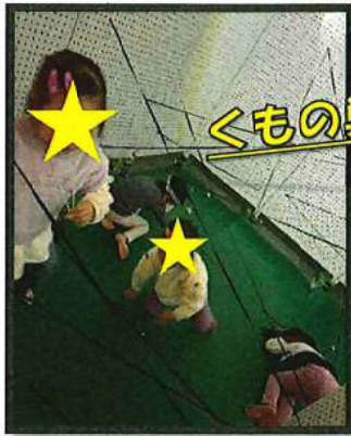
くもの巣くぐりの術